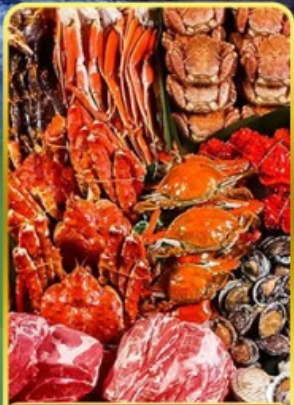
บึงย่างฟรีเมี่ยมมันตะ