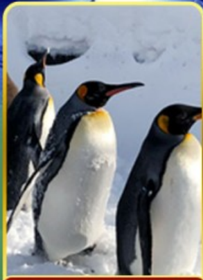
พาครอบครัวไปชม