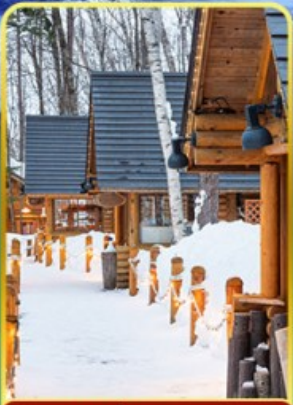
นิงเกิ้ลทอโร