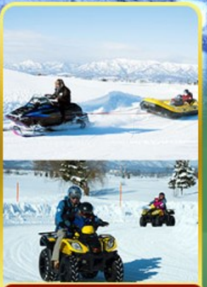
BIBAI SNOW LAND