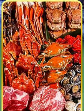
ปิ้งย่างพรีเมียมมันตะ