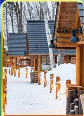
บึงเกลือทอโร