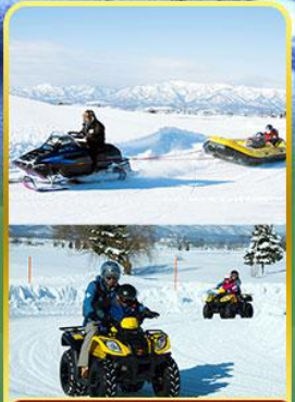
BIBAI SNOW LAND