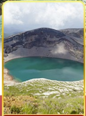
ปากปล่องภูเขาไฟซาโอ