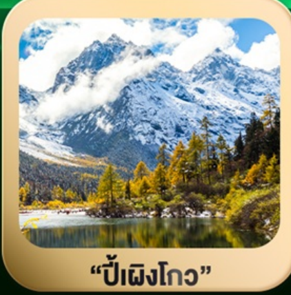
“ปี้ฝิงโกว”

ชมธรรมชาติ 2 อุทยานขึ้นชื่อ อุทยานภูเขาสี่ครุณี + อุทยานปี้ฝิงโกว สะพานหนานเฉียว • ถนนคนเดินไท่กู่หลี่ + ซุนซีลู่ + Pop Mart • ดงเจียวจี้