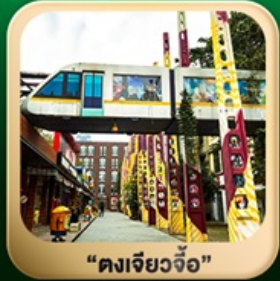
“ดงเจียวจี้”