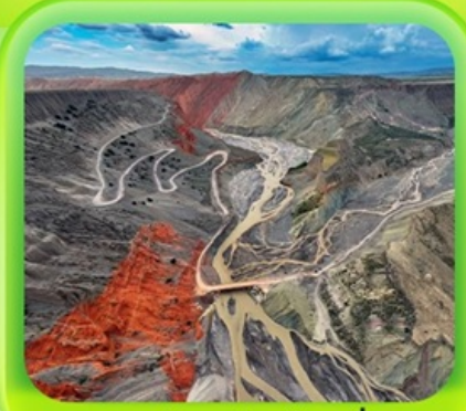
"แกรนด์แคนยอนคู่ชาวจื่อ"

ซินเจียงเหนือ ทะเลสาบไซลีมู่ "น้ำตาหยดสุดท้ายของแอตแลนติก" • กุ้งหน้านาราตี กุ้งดอกไม้เทียนซาน • ผ่านชมสะพานกั๋วจื่อโกว • ถนนหลิวซิงเจียง • ตลาดต้าปาจา