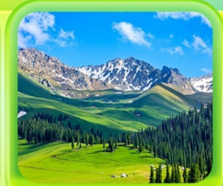
"กุ้งหน้านาราตี"