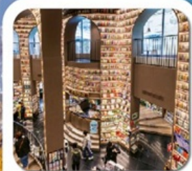
"ห้างสรรพสินค้า จงซูเก๋อ"