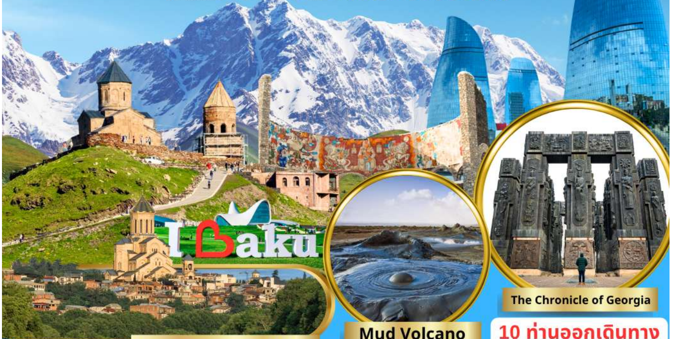
Holy Trinity Cathedral of Tbilisi