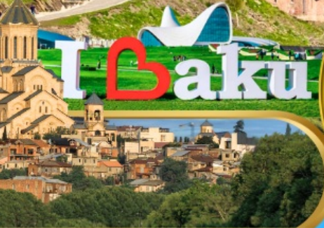
Holy Trinity Cathedral of Tbilisi