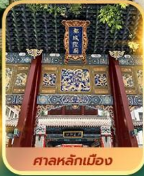
ศาลหลักเมือง