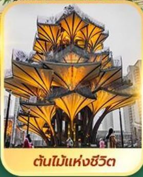
ต้นไม้แห่งชีวิต