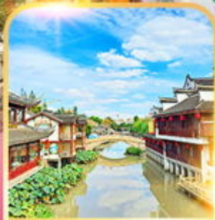
เมืองโบราณซีเป่า