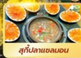
สุกัปลาเซลมอน