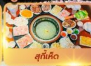
สุกัเห็ด