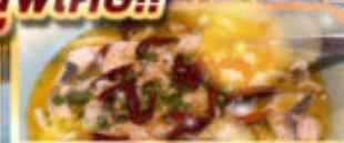
ปลาต้มผักกาดดอง