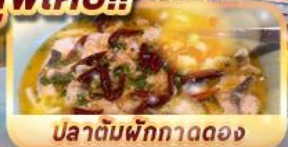
ปลาต้มพริกทอดดอง