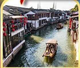
เมืองโบราณจูเจียเจี๋ย