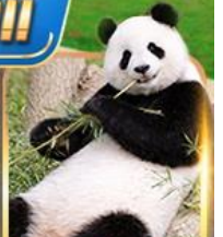
สวนสัตว์จงชิ่ง