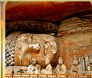
พาคืนพระแกะสลักต้าจู๊