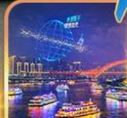
ล่องเรือแม่น้ำแยงซีเกียง