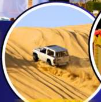
รถเช่าราย 4X4

เริ่มต้น 10 ท่าน คอนเฟิร์มเดินทาง 37,988.- มกราคม - พฤษภาคม 69