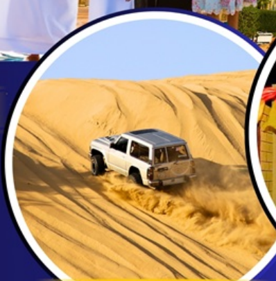
ทะเลทราย 4X4