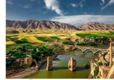
เมืองดารา