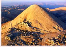
สะพานเซเวอร์ริน สุสานคาราคูช ชมพระอาทิตย์ตกดิน

** พักที่ Nemrut Euphrat Hotel 4* หรือเทียบเท่า **