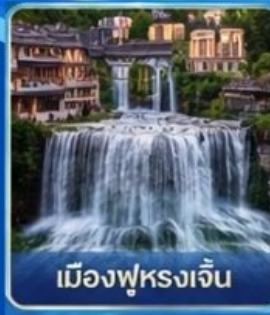
เมืองฟูรงเจิน