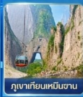
ภูเขาเทียนเหมินซาน