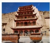
ถ้ำม่อเถา