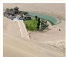
เขื่อนทรายหมิงซาซาน