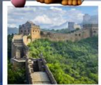
กำแพงเมืองจีนด่านซือหม่าไท่

เมืองโบราณกุ่เป่ย์ซู่ยี่จิน / กำแพงเมืองจีนด่านซือหม่าไท่ (รวมค่ากระเช้าขึ้น-ลง) / ชมวิวกำแพงเมืองจีนและเมืองโบราณ ยูนิเวอร์แซลปักกิ่ง (รวมค่าบัตรเข้า) / จัตุรัสเทียนอันเหมิน / พระราชวังโบราณกู้กง / หอบูชาเทียนถาน คาเฟ่กาแฟบ้านน้ำตาล (TANG FANG CAFE) / พระราชวังฤดูร้อนอวิ๋เหอหยวน / ย่านชานหลี่ถุน (POP MART) / ถนนคนเดินไท่กู่หลี่