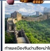
กำแพงเมืองจีนด่านซือหม่าโต