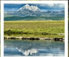
ดวงตาแห่งต่าง

หมู่บ้านทิเบตเจียจวี • จุดชมวิวกุหลาบหิมะหย่าลา • ป่าห่มย สวนหินปาหลาง • จุดชมวิวดวงตาแห่งต่าง • วัดมู่หย่า หมู่บ้านเก๋อริ้อหม่าซุน • ซินตูเฉียว • หมู่บ้านกู่หน่งซุน หมู่บ้านปาหลางเฉิงตู • เมืองลอยฟ้าเก๋ตี้ลามู่ • ภูเขาจื่อตั่วชาน ถนนสายรุ้ง • ทะเลสาบแดง • ถนนคนเดินชอยกวางแคบ