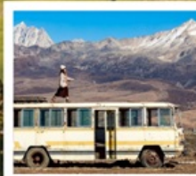
เมืองลอยฟ้าเก๋ตี้ลามู่

ทัวร์คุณธรรม ไม่ลงร้านช้อปปิ้ง ไม่ขายออฟชั่น