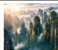
เซาอวตาร

สะพานแกว่ที่ยาวที่สุด • ตึก 72 ชั้น • เซาอวตาร • เซาเทียนจื่อซาน • สวนจอมพลเอ่อหลง โซ่วนางจิงจอกขาว • เซาเทียนเหมินซาน • ระเบียงแกว่ • ประตูดวงรุ้ง • เมืองฟุ่หลงเจิ่น น้ำตกฟุ่หลง • ฟังหวง • ถนนหวงซิงลู่ (POP MART) • สะพานสายรุ้ง • เมืองโบราณฟังหวง ล่องเรือตามลำน้ำถั่วเจียงชมเมืองโบราณฟังหวงยามค่ำคืน