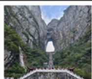
เซาเทียนเหมินซาน