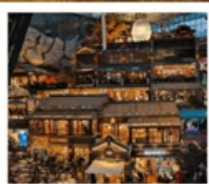
THE HILL CHANGCHUN