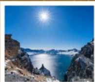
อุทยานอางโป่ซาน