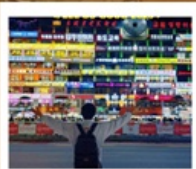
กำแพงมหาวิทยาลัยเหยียนเปียน