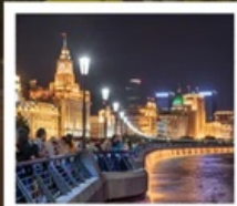
เซี่ยงไฮ้คลาสสิกไนท์

เซี่ยงไฮ้ คลาสสิก ไท่ / 3 ตึกใหญ่แห่งเซี่ยงไฮ้ ล่องเรือหมู่บ้านโบราณจูเจียเจี้ยว / EKA Tianwu / ถนนหอยไผ่ วัดหลงหัวแลนด์มาร์ก จางหยวน / ซินเทียนตี้ / ชมโชว์ ERA ที่โรงละครโด่งดังระดับโลก