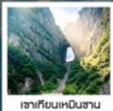
เขากิยอนเหมินซาน

ล่องเรือสำน้ำถั่วเจียงชมเมืองฟ่งหวงยามค่ำคืน / สะพานสายรุ้ง / เมืองโบราณฟ่งหวง น้ำตกฟูหลงเจิน / เขากิยอนเหมินซาน / ระเบิดยงเก้ว / ประตูสวรรค์ / ไชว์นางจิ้งจอกขาว ตึก 72 ชั้น / แกรนดเคนยอน / สะพานแก้ว / เขาอวตาร / สวนจอมพลเอ่อหลง ห้างเหวหนือไฮ่ว / ซุปบิงร้านขนมยักษ์ / ถนนหงซิงลู่ (POP MART) / ซุปบิงเอ๋ากี้กวางซา