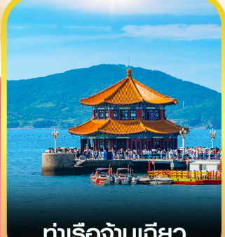
ท่าเรือจันทิว