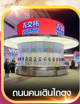
ถนนคนเดินโกตง