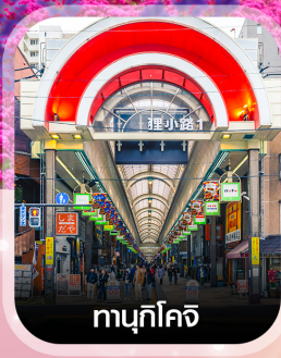
ทามุกิโคจิ

คอนเฟิร์ม ออกเดินทาง ทุกพีเรียด 2 ท่านขึ้นไป