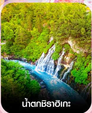
น้ำตกชิราอิเกะ