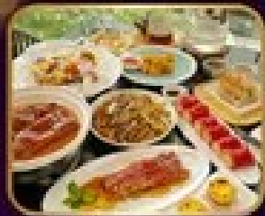
อาหารจีน ๓๐ มื้อ