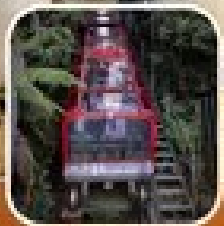
อุทยานอนุสรณ์แห่งแรก