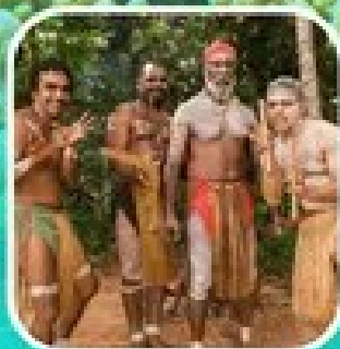
Rainforestation Aboriginal Show