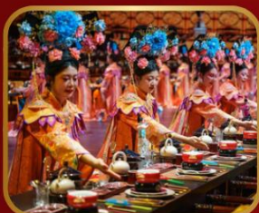
ภัตตาคารวังหลวง YU XIAN DU