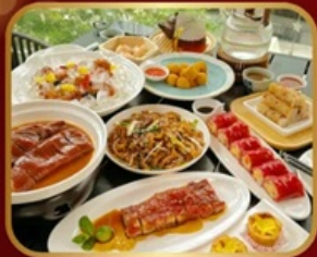
อาหารระดับ มิชลิน TAO TAO JU