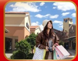
อิสระช้อปปิ้ง BEIJING OUTLET