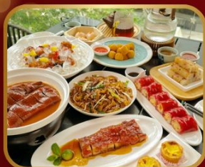
อาหารระดับ มิชลิน TAO TAO JU