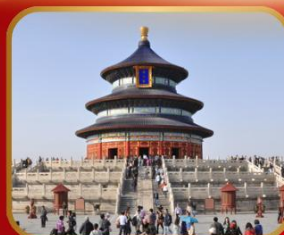
ชมความงดงาม หอฟ้าเทียนถาน