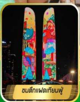
ชมตึกแพนด้าเทียนฟู่