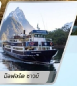
มิลฟอร์ด ซาวน์