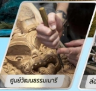
ศูนย์วัฒนธรรมเมารี