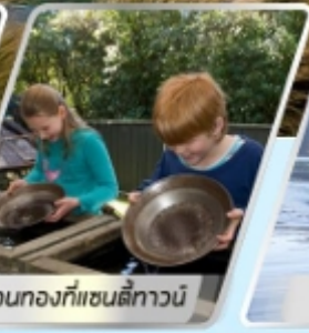
ล่องทงกที่แซนตีทาวน์