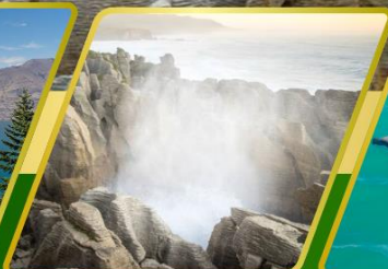
ไปโฮ, แพนเค็กหรือค