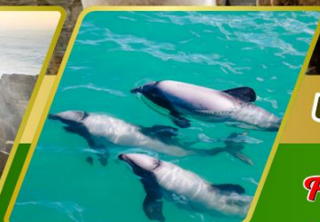
ล่องเรือชมโลมา