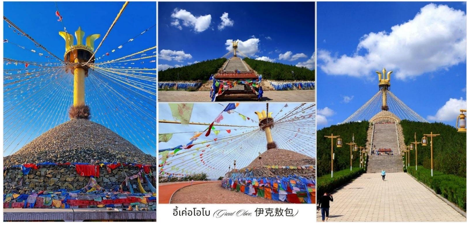
อี้เค่อโอบอ (Great Oboo, 伊克敖包)

นำท่านชม อี้เค่อโอบอ (Great Oboo, 伊克敖包) สถานที่แห่งนี้ไม่เพียงเป็นศูนย์รวมจิตใจของชาวมองโกล แต่ยังเป็นจุดชมวิวที่โดดเด่นของเมืองคังปาซ้อ สำหรับชาวมองโกลแล้ว อี้เค่อโอบอเปรียบเสมือนสะพานเชื่อมระหว่างสวรรค์และโลกมนุษย์เป็นสถานที่ที่ผู้คนมาเพื่ออธิษฐานขอพรให้ประเทศชาติสงบสุข ผู้คนมีความสุขและความเจริญรุ่งเรืองตลอดไป การเดินวนรอบโอบอตามเข็มนาฬิกาสามรอบเป็นธรรมเนียมปฏิบัติ เพื่อความเป็นสิริมงคล จากนั้นนำท่านเดินทางสู่ทุ่งหญ้าออร์ดอส ใช้เวลาเดินทางประมาณ 2 ชั่วโมง