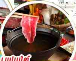
บุฟเฟ่ต์ ซาบูกัมโปไฟโตทวัน