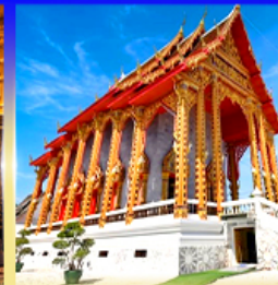
วัดอินทาราม