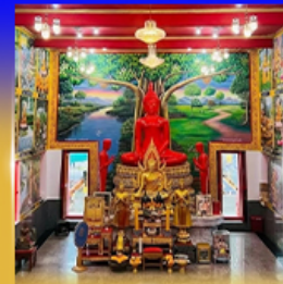
วัดบางพรหม