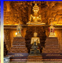
วัดบางแคน้อย