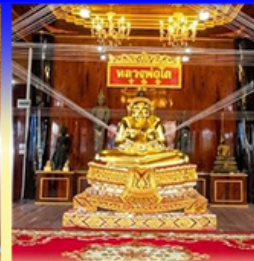
วัดเกษมสรณาราม