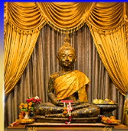
วัดภูมรินทร์กุฎีทอง