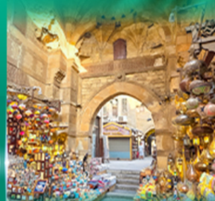
ตลาดผ่านเวลกาลี่