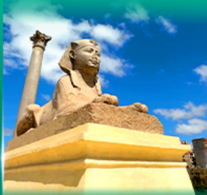
เสาริมันปอมเปย์