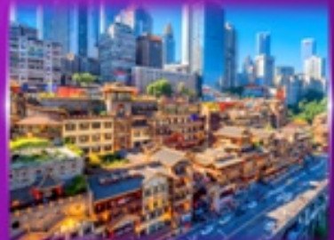
เซ็คฉินย่านตึง หงหยาดัง