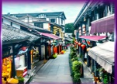
หมู่บ้านโบราณฉิวซีโ่ว