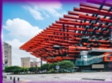
แลนด์มาร์กฉิง ตึกตะเกียบ