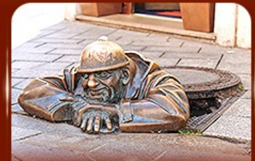
แลนด์มาร์คดัง รูปปั้นคูนิล ปรากติสลาวา