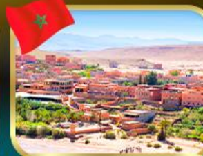
เมือง ไอท์ เบนฮัดดู