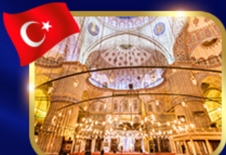
ชมความงามสุหร้าสีน้ำเงิน