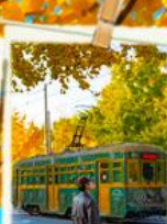
ถ่ายรูปปรตราง201