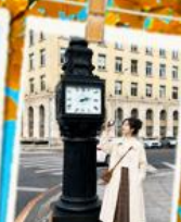
จตุรัสวงชาน