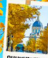
ถนนหนานชาน