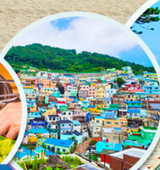
หมู่บ้านดัมซอน