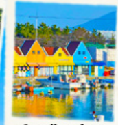
ท่าเรือสีสัน