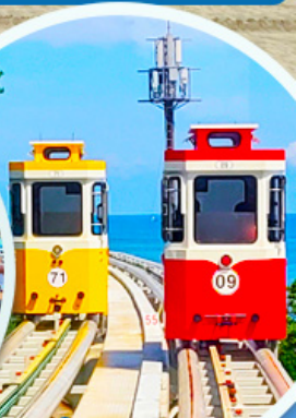
นั่งรถไฟปู๊กบีก

ราคานี้รวมค่าภาษีน้ำมัน + ค่าภาษีสนามบิน ** ปรับขึ้น ณ วันที่ 1 เม.ย. 69 เรียบร้อยแล้ว **