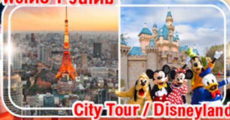
City Tour / Disneyland