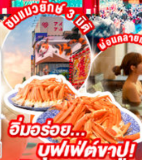
ชิมอร่อย... บุฟเฟ่ต์ซาปู!