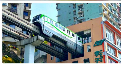
รถไฟฟ้าสุดคึก