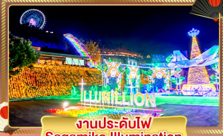
งานประดับไฟ Sagami Illumination