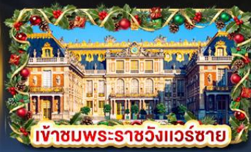
เข้าชมพระราชวังแวร์ซาย