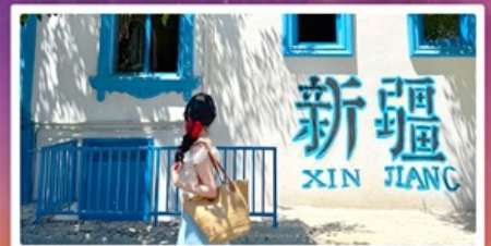
ถนนคนเดินหลิวซิงเจียง