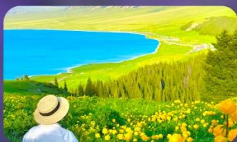
ทะเลสาบไซ่หลี่มู่