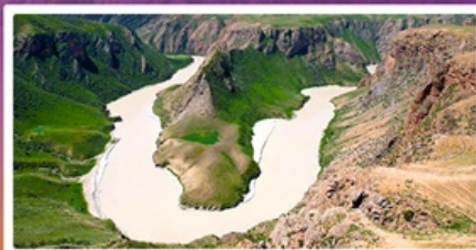
แกรนด์แคนยอนดูซานจื่อ