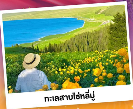
ทะเลสาบไซเหล็่มู่