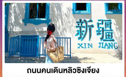
ถนนคนเดินหลิวซิงเจียง