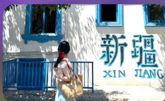
ถนนคนเดินหลิวซิงเจียง