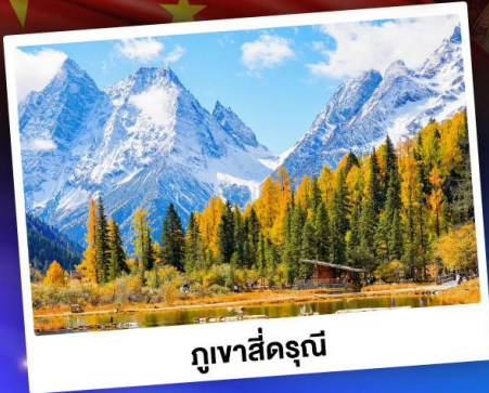
กูเขาสี่ดรุณี

"สถานที่ท่องเที่ยว 5A อุทยานจิ๋วจ้ายโกว"