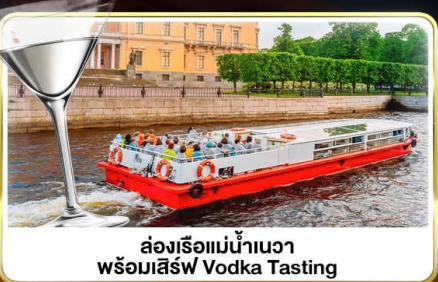
ส่องเรือแม่น้ำแคว พร้อมเสิร์ฟ Vodka Tasting