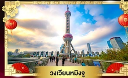
วงเวียนหมิงจู