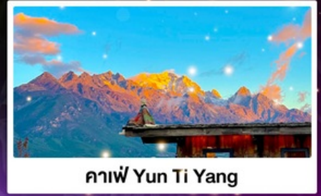
กาแฟ Yun Ti Yang