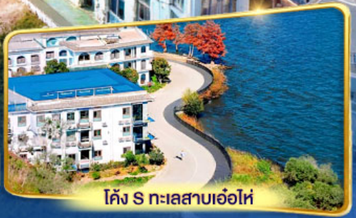
โค้ง S ทะเลสาบเอ๋อไห่